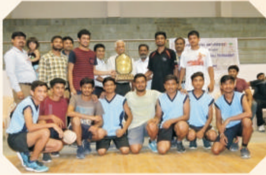
Champion in Boys Basketball Intercollegiate Competition, organized by Sardar Patel University at Bakrol 2017 – 18