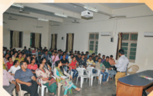
GST Awareness Session