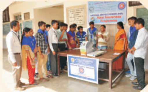
Election Awareness Programme

Placement Cell : Placed Students with Staff