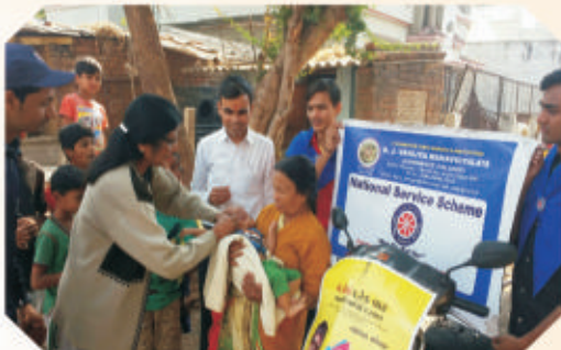
Pulse Polio Programme