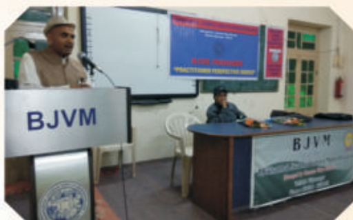
Expert Lecture Series