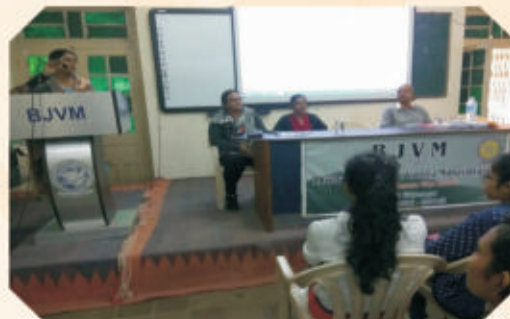
Women Awareness Programme