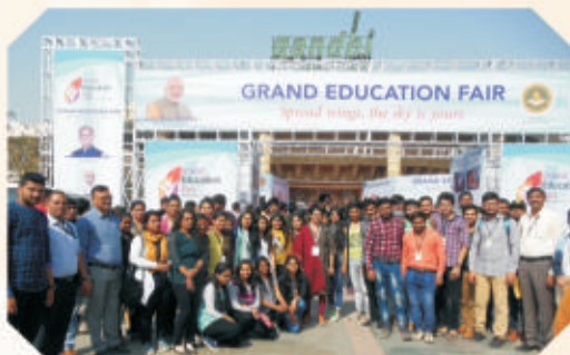
Grand Education Fair Tour 2017-18