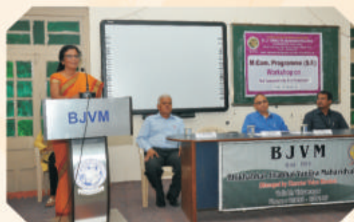
Skill Development Workshop