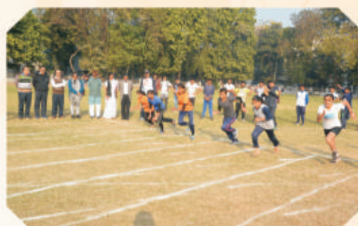
Sports Day Celebration