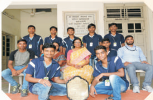
Runners up in Boys Cross Country Intercollegiate Competition, organized by Sardar Patel University at Bakrol 2017– 18