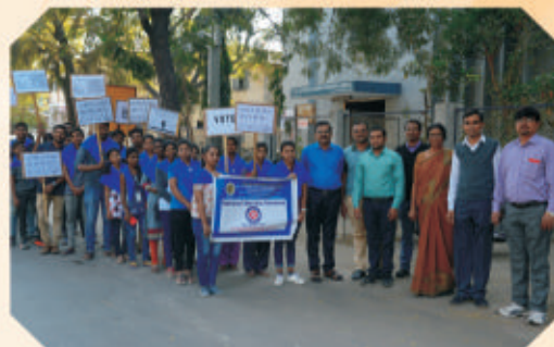
National Voter's Day Celebration