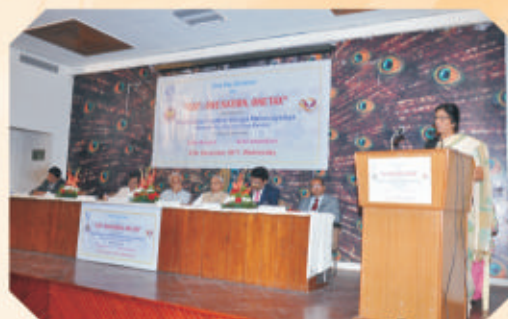
One Day Conference on GST