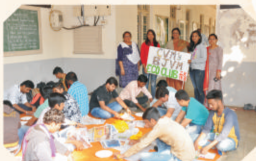
Eco Club at BJVM