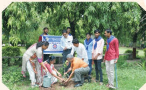
World Environment Day & Tree Plantation