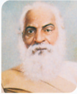
Vir Vitthalbhai Z. Patel