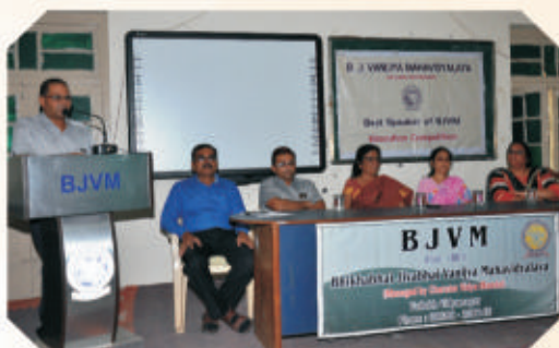
Best Speaker of BJVM Competition