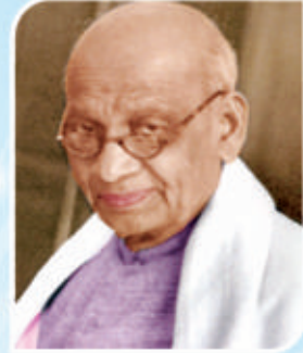
Sardar Vallabhbhai Patel