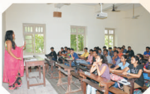
Teacher's Day Celebration