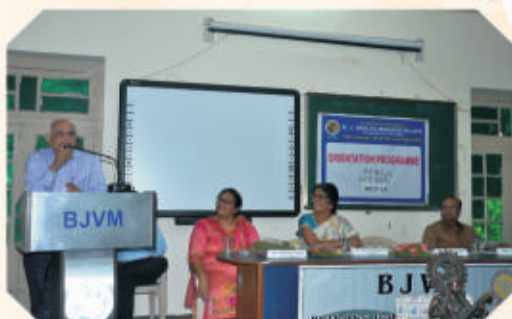
Orientation Programme of FYBCOM & BBA