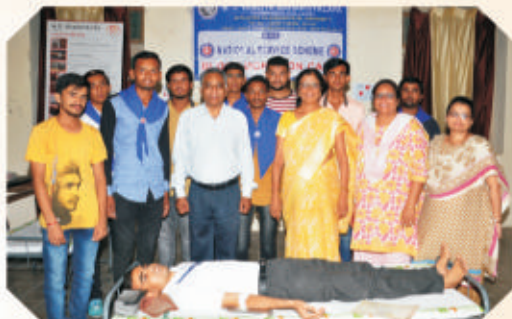
Blood Donation Camp