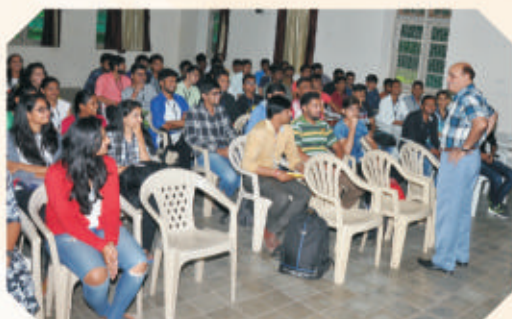
Two Days Leadership Training