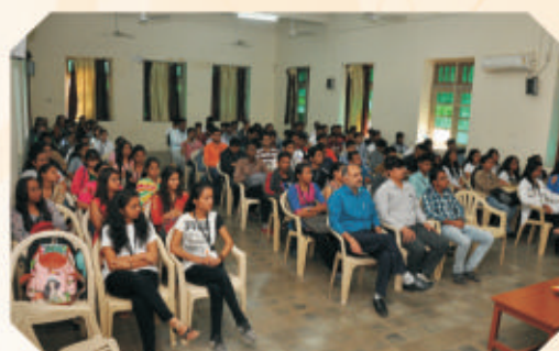
Entrepreneurship and Innovation Workshop