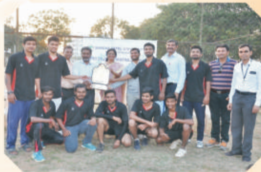
Champion in Boys Handball Intercollegiate Competition, organized by Sardar Patel University at Bakrol 2017 – 18