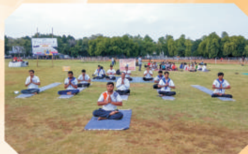
Yoga Day Celebration