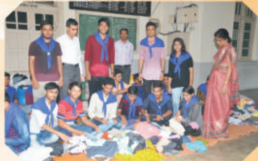
Flood Health Cloth Camp