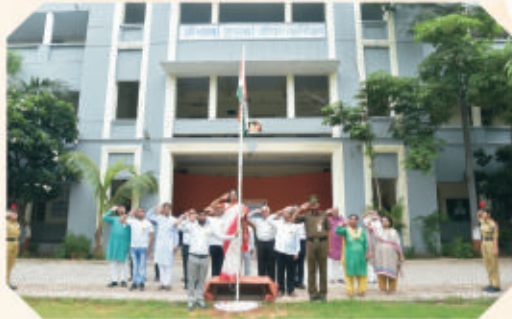
Independence Day Celebration