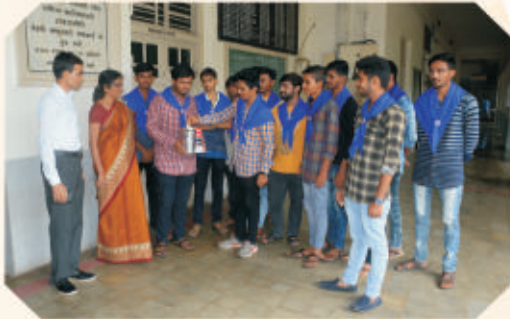
Army Welfare Fund