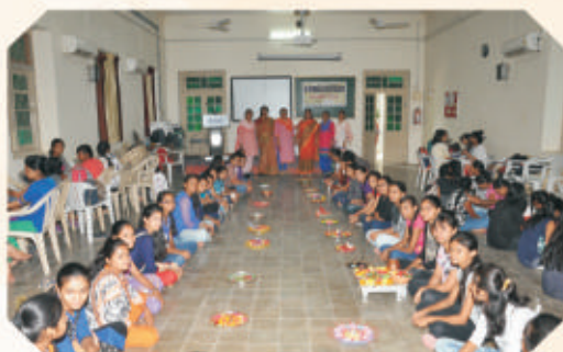
Aarti Decoration Competition