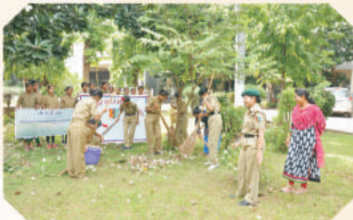
Swatchhta Abhiyan by NCC Girls of BJVM