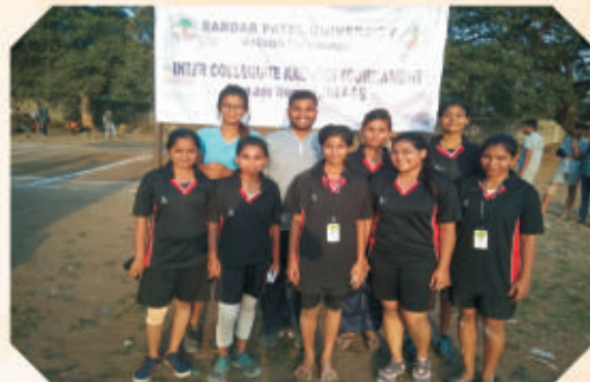
Fourth Place in Girls Kabaddi Intercollegiate Competition, organized by Sardar Patel University at Bakrol 2017 – 18